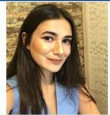
Duygu Ceren Güngör Hemşirelik Fakültesi